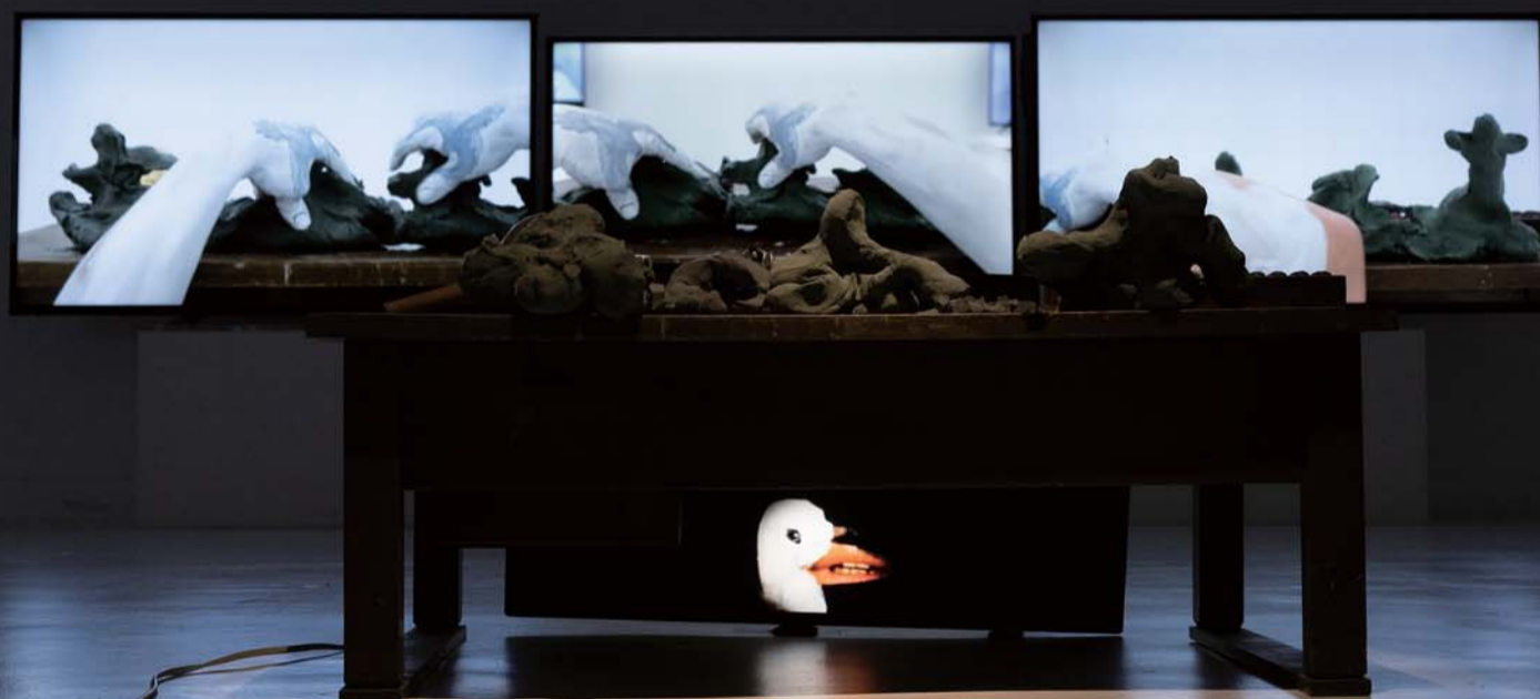
(参考) 黒田大スケ《三つのカゲ、彼の罪》2021