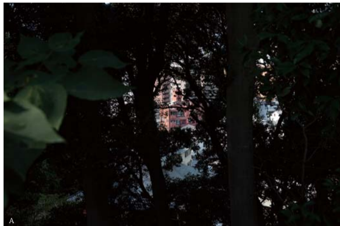
A.《Treatise on Light_HR0109》2021 撮影 / B.《Treatise on Light_HR9889》2021 撮影 / C. 展示風景「絵画のなかの風景」なかつ美術館 2020、©Kiyohito Mikami

なお、本展示会は文化庁が実施している「新進芸術家海外研修制度」の成果発表の機会として開催される「DOMANI・明日展」との連携事業として実施するものです。